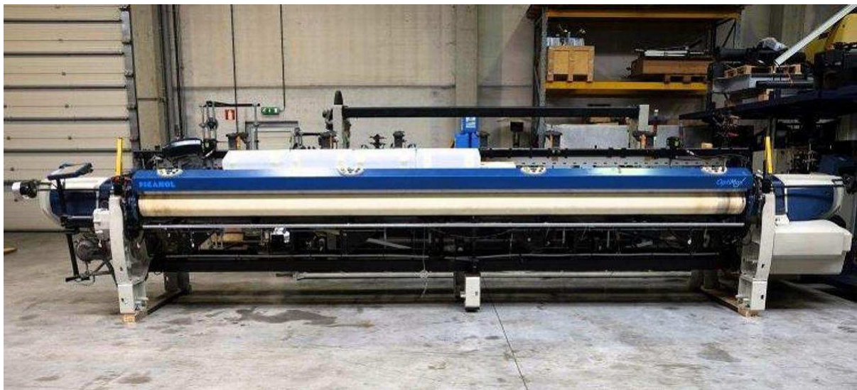
PICANOL MOD. OPTIMAX-4-R-540