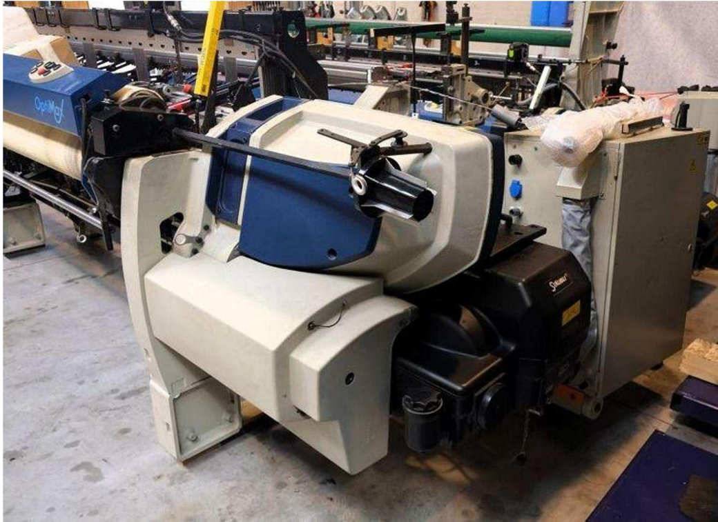
Sistema eletrônico Dobby Staubli