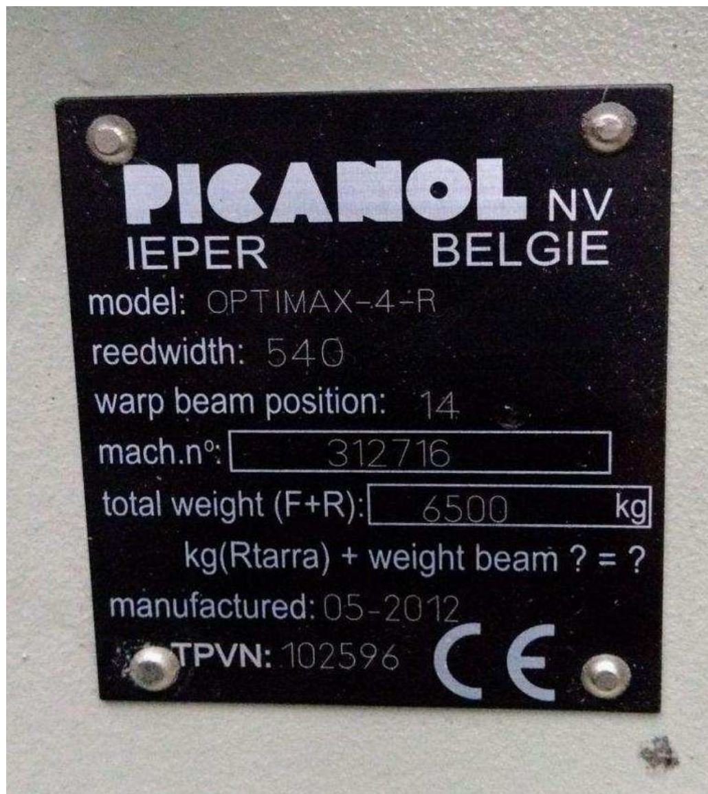
Placa de Identificação